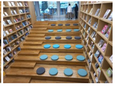
ภาพอาคารสถานที่ สำนักหอสมุดกลาง วังท่าพระ